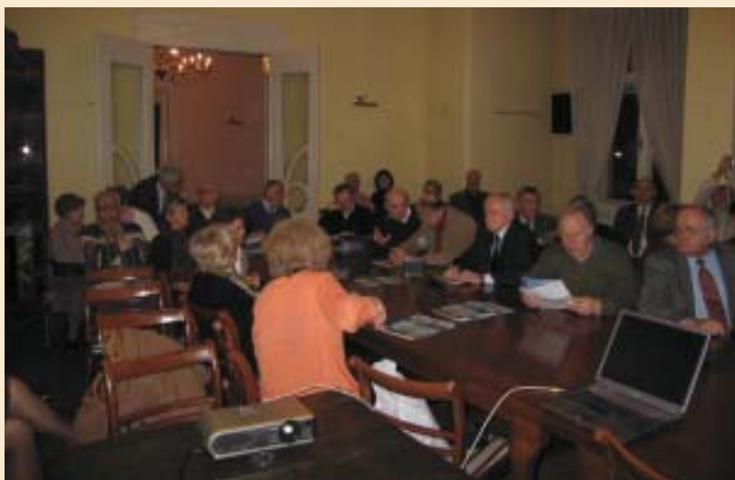
Redovita druženja članova HPZ-a