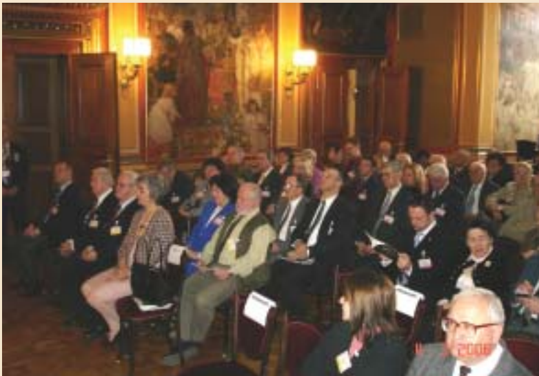
Članovi prate izlaganja