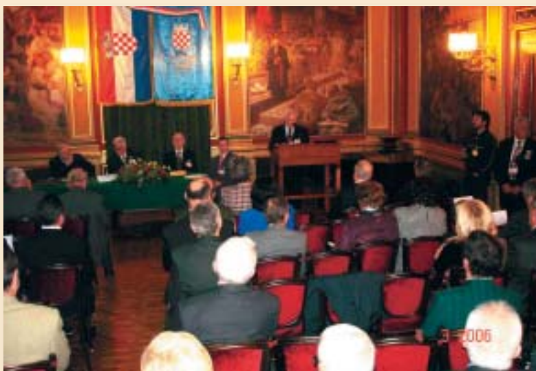
Predsjedništvo svečane sjednice Velikog plemićkog vijeća